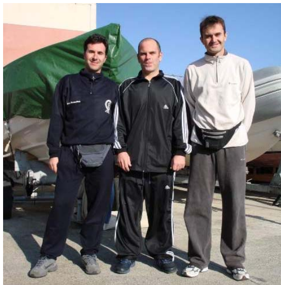
La squadra "LNI Savona 1"