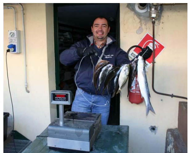
Carniere LNI Savona 1