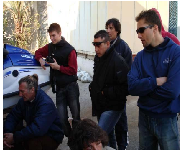
I partecipanti durante le fasi della pesatura

Quando è il turno di Olimpia sub 1, la bilancia scarta la metà delle prede catturate, mentre le restanti tre hanno un peso di 1715 grammi che, sommati a due coefficienti specie, ottengono 3215 punti.