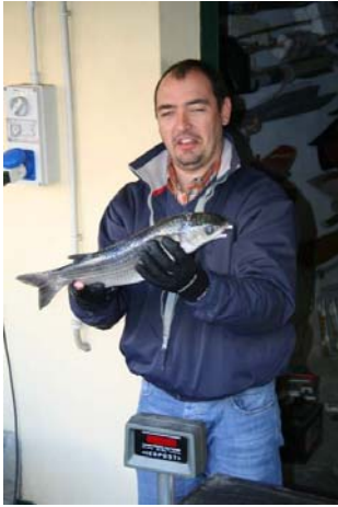
Carniere LNI Savona 2

Poi tocca alla "squadra 1" della LNI Savona, che ha tutti i pesci validi tranne la salpa che viene scartata per pochi grammi, per un peso complessivo di 3600 grammi e tre specie catturate realizzando così un punteggio di 6600 che la porta momentaneamente al comando della classifica, in attesa della pesatura del carniere di Olimpia sub 1 che, per quantità di pezzi catturati rispetto agli altri, potrebbe essere l'unico in grado di totalizzare un punteggio superiore.