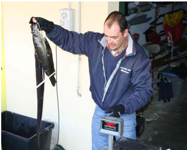
Carniere Olimpia Sub 1

La "squadra 2" della LNI Savona ha entrambe le prede catturate valide per un peso complessivo di 1905 grammi che vanno sommati ai coefficienti di due differenti specie ottenendo così 3105 punti.