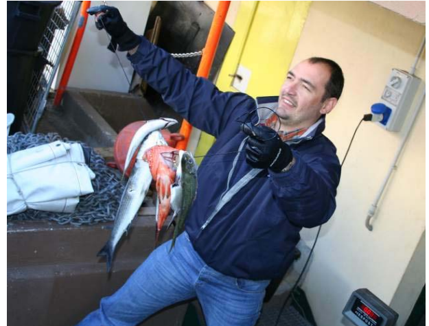
Carniere Olimpia Sub 1

La "squadra 2" della LNI Savona ha entrambe le prede catturate valide per un peso complessivo di 1905 grammi che vanno sommati ai coefficienti di due differenti specie ottenendo così 3105 punti.