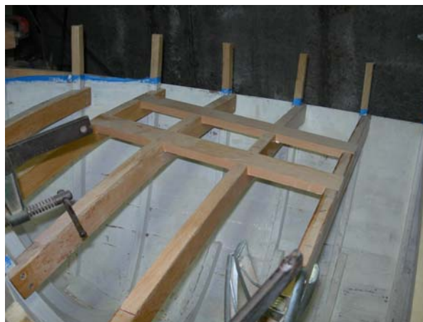
Rinforzo dei "bagli"