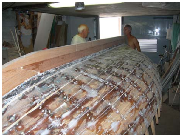
La nuova chiglia