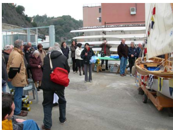
La festa dell'inaugurazione