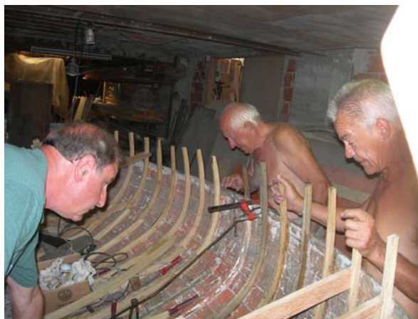
Prova di ogni nuova "ordinata"