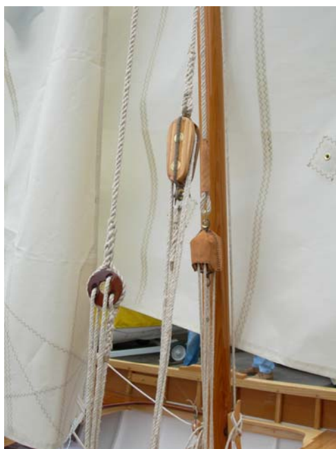
Bozzelli in opera