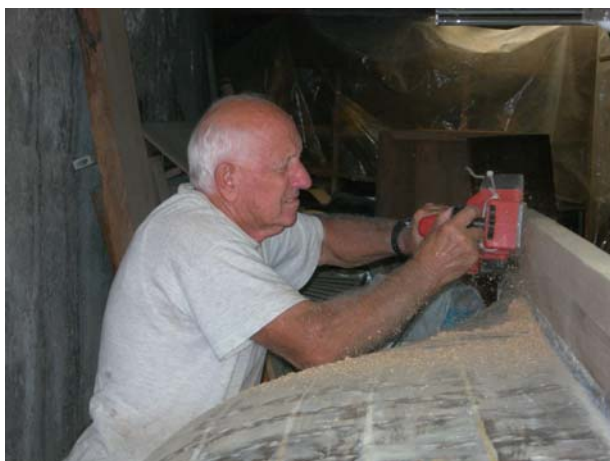
Rastrematura della chiglia