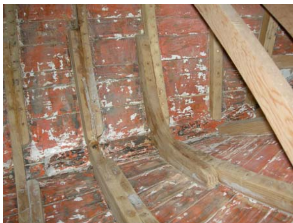
Particolare del "madiere"