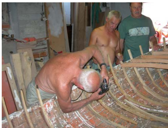
Fori per i chiodi