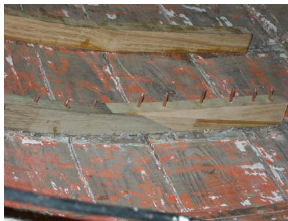
I chiodi in rame