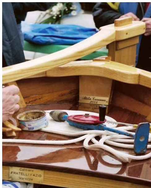
Targhette: Cantiere Fazio 1966 Restauro Cavanna 2005