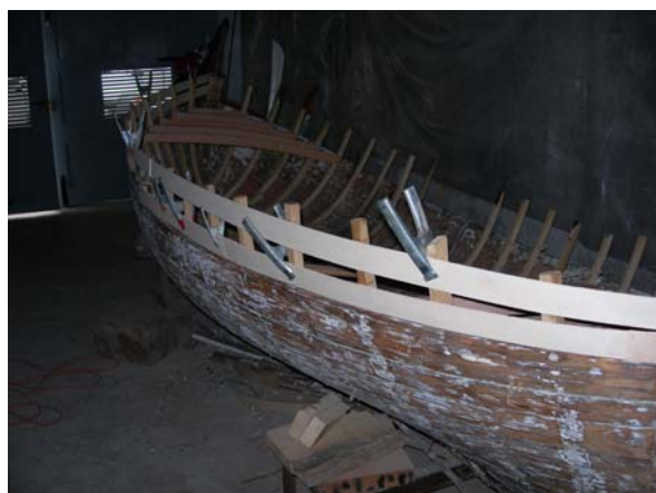
La sesta per la messa in forma dell' "ultima tavola"