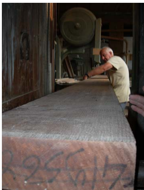
Asse di 6 m per l'albero e la penna in legno di "silver spruce"