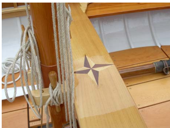
L'elegante panchetta finita