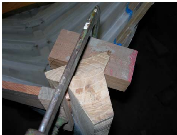
La precisione del tacco a incastro per il "sergent"